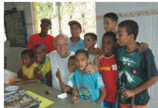
Casa do Menor